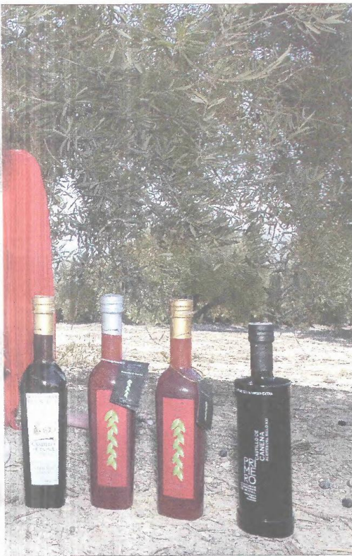
con los que Castillo de Canena llega a los mercados.

to es que cada vez hay más gente que se lo plantea y que trabaja en esa dirección. —En una coyuntura económica como la actual, ¿cómo se recibe fuera el aceite de oliva? —Hay dos tipos de mercado. El que ve que los precios se despeñan, el que sólo mira el céntimo por litro, los graneles y las grandes operaciones y, diferenciado, está el mercado del envasado. Creo que este segundo está aguantando mejor que el primero. Es importante que la gente exporte porque diversifica los riesgos, abre oportunidades y, con un esfuerzo similar, multiplica los resultados.